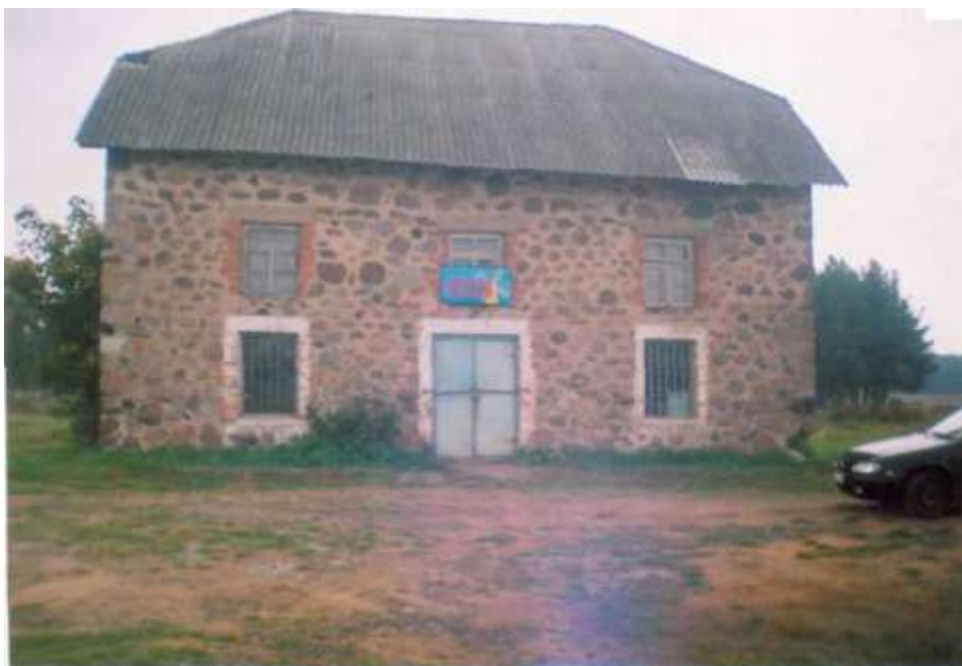
Млын вёскі Забалаць Воранаўскага раёна