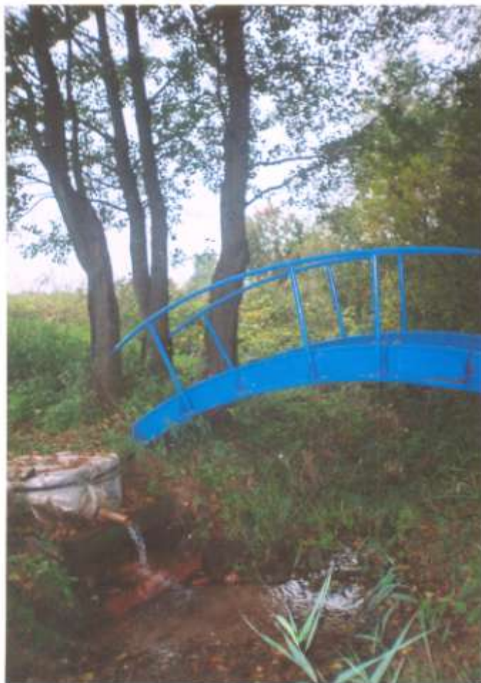
Крыніца ля вёскі Мантуны