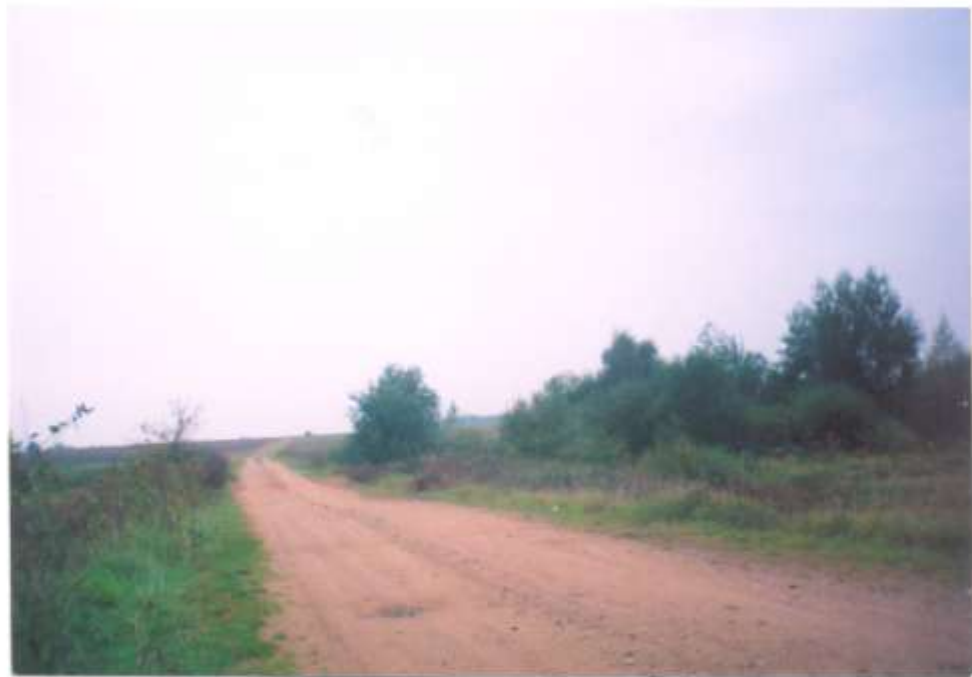
Мантунская града, працягласць 15 км