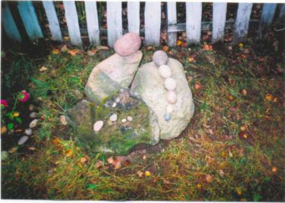
Прырода і фантазія