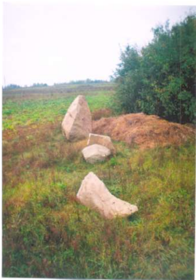
Валуны каля вёскі Навасады