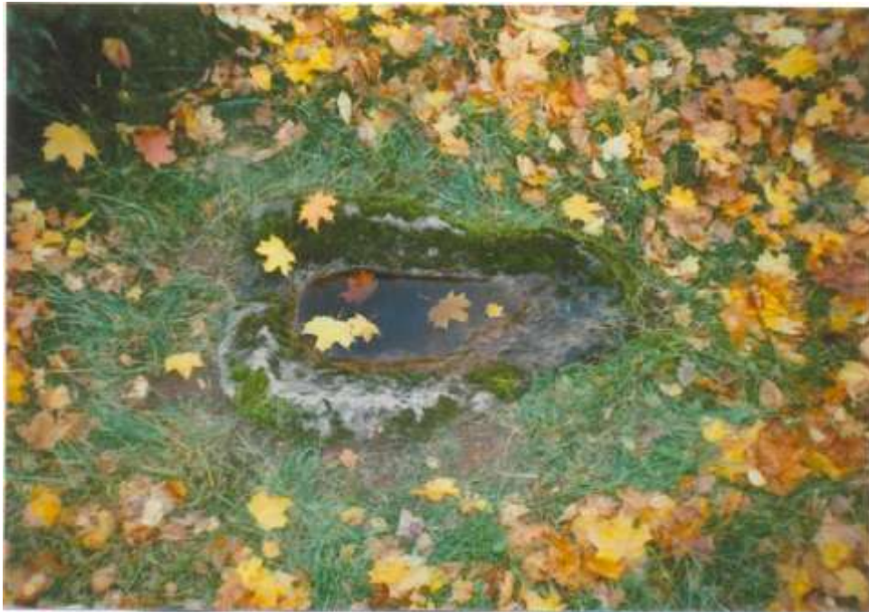
“Боская Міска”, парк Навасадскай БШ