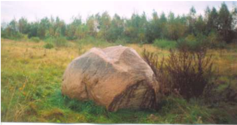
Валун каля дарогі Навасады-Забалаць