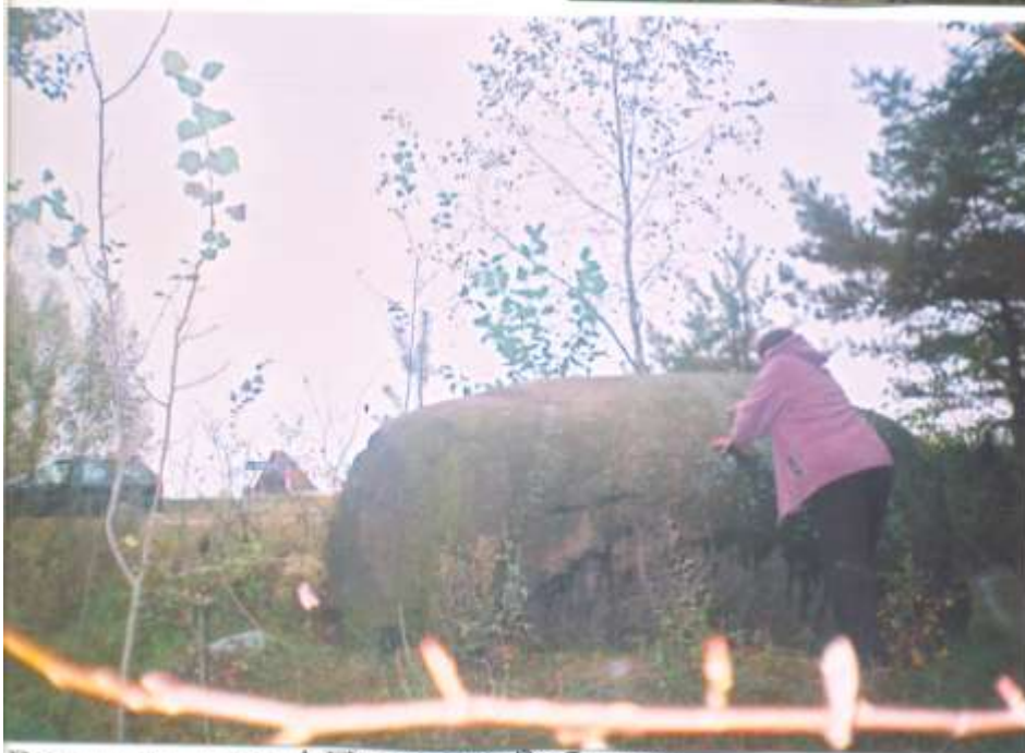
Валун ля дарогі Праважа-Забалаць