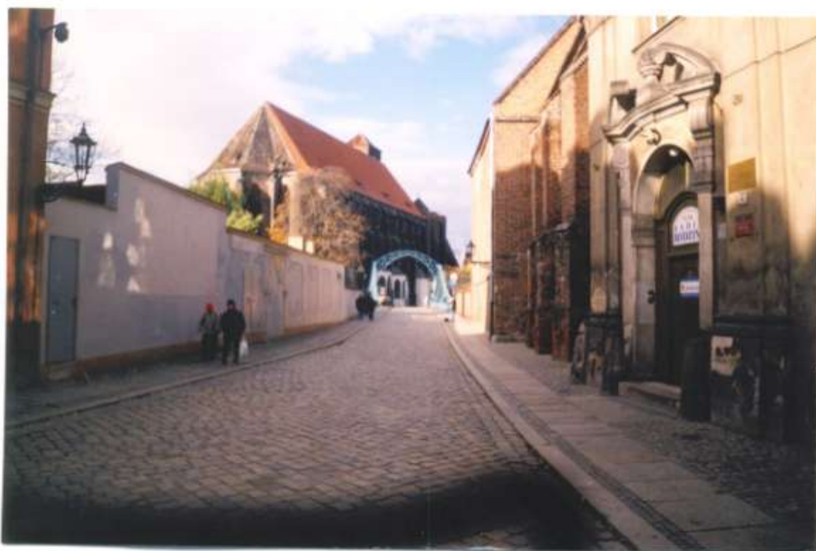
Брукаваная вуліца, г.Вроцлаў