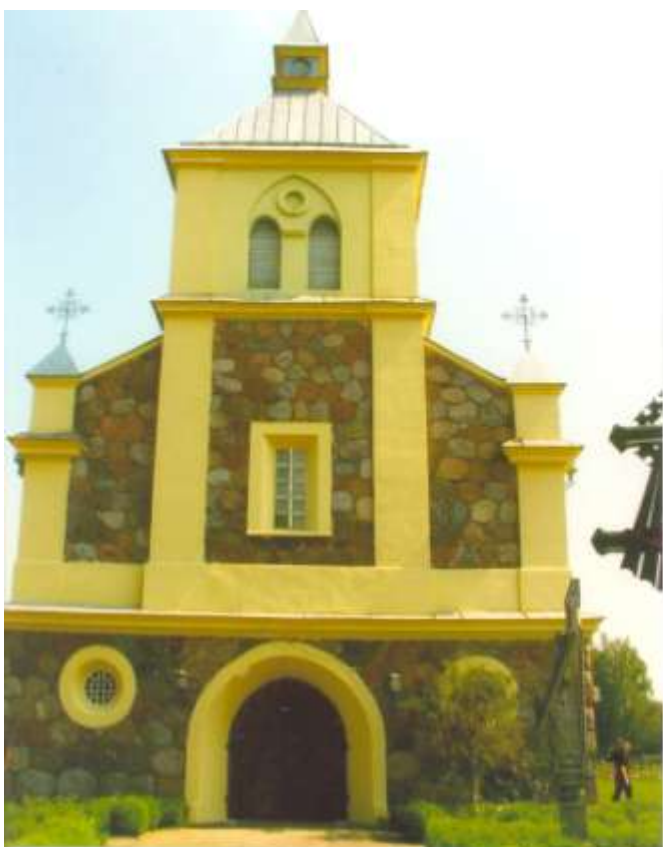
Касцёл св.Лінаса в. Пеляса Воранаўскага раёна