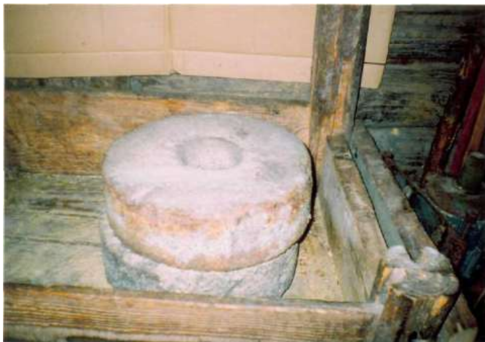
Жорны (в.Навасады, Анаровіч М.І.)