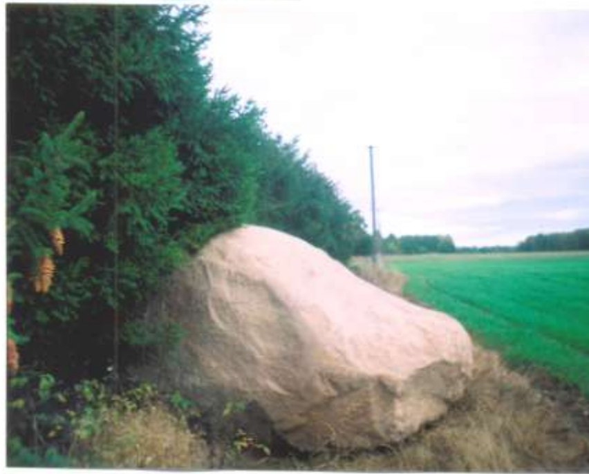
Валун ля хутара Супронаў